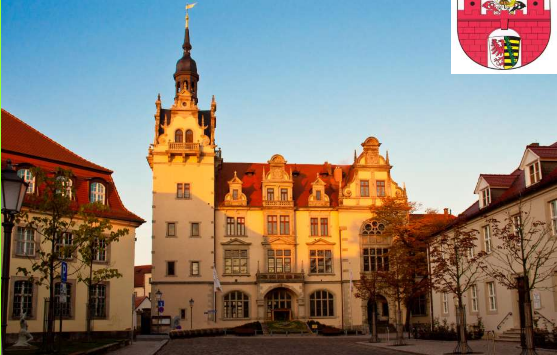
Rathaus der Stadt