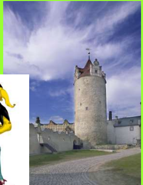
Eulen- spiegel- turm