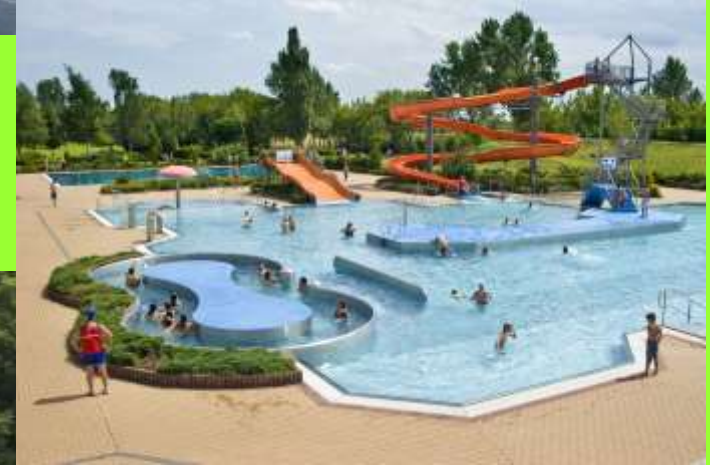
Märchengarten, Tierpark, Schwimmbad und Parkeisenbahn