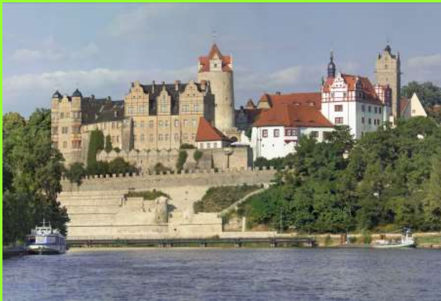
Schloss Bernburg (Saale)