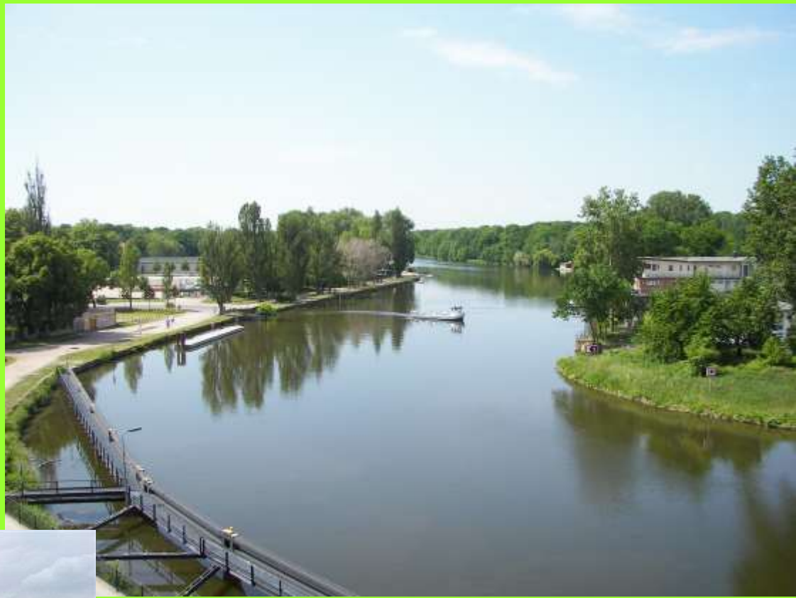
Saale am Ortsteil Gröna