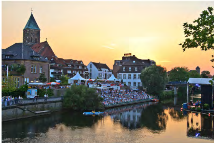
EmsFestival - mit schwimmender Bühne