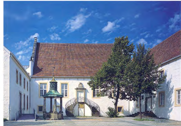
Falkenhof - das Stadtmuseum