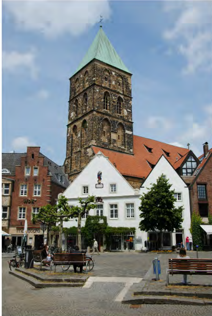
Marktplatz Rheine mit Stadtkirche St. Dionysius