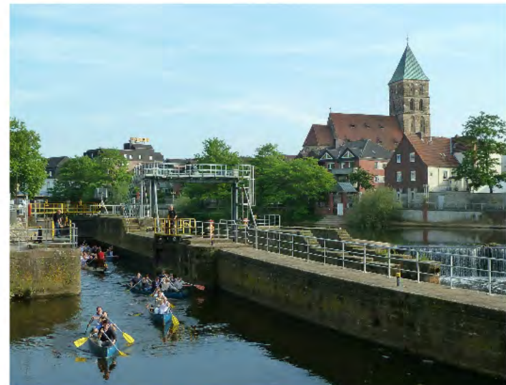
Emswehr mit Stadtkirche St. Dionysius